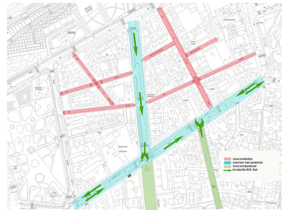
RECORRIDO AUTOBUSES TRANSPORTE PÚBLICO URBANO